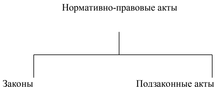
Рисунок 2 – Виды нормативно-правовых актов 1

Если рисунок является авторской разработкой, необходимо после заголовка рисунка поставить знак сноски и указать в форме подстрочной сноски внизу страницы, на основании каких источников он составлен, например: